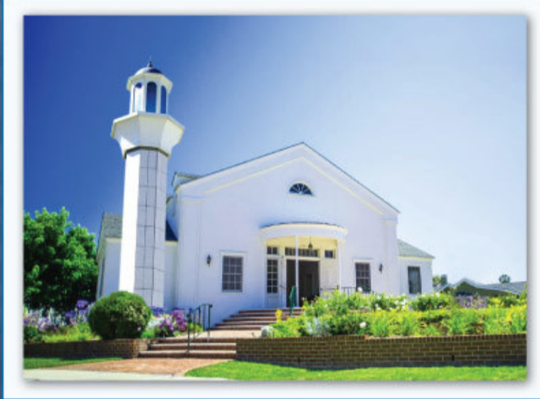
صورة الكنيسة التي يجري شراؤها (المدينة تعرض في الصورة)